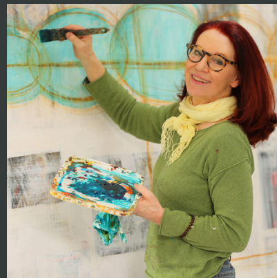
Abbildungen: Vorderseite: Bestätigen Sie, dass Sie ein Mensch sind, 140 x 140 cm Resonanzsphäre Natur, 100 x 100 cm

Die Arbeiten von Ingrid Wild kreisen um grundlegende Fragen des Menschseins. Die Ausstellung lädt dazu ein, über Wahrnehmung, Identität und die Stellung des Menschen in einer Gegenwart nachzudenken, die von digitalen Einflüssen, künstlicher Intelligenz sowie echten und falschen Bildern geprägt ist. In ihren farbindensiven Werken verbindet Ingrid Wild Malerei mit skripturalen Elementen und Collagetechniken. Im Spannungsfeld zwischen Abstraktion und Figuration deuten sich Formen an, lösen sich auf und formieren sich neu.